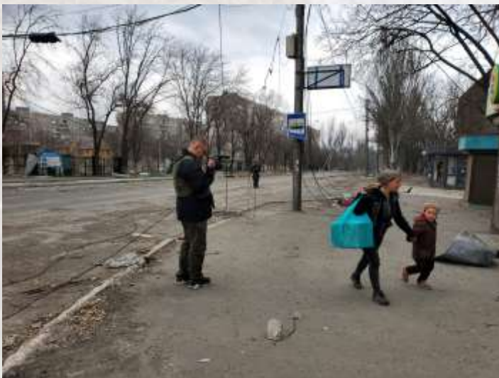
Фото командировки сотрудников Фонда в ЛДНР для выявления нуждающихся в помощи детей и подготовка к транспортировке на территорию РФ